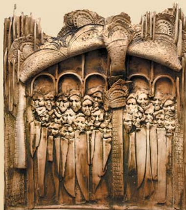
Kantata , 40×50 cm, porcelit