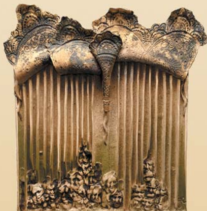
Fuga , 40×50 cm, porcelit