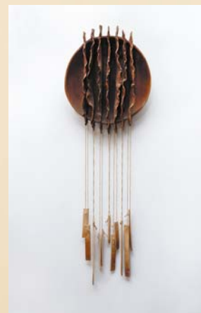
Kompozycja muzyczna 25×50 cm, porcelit