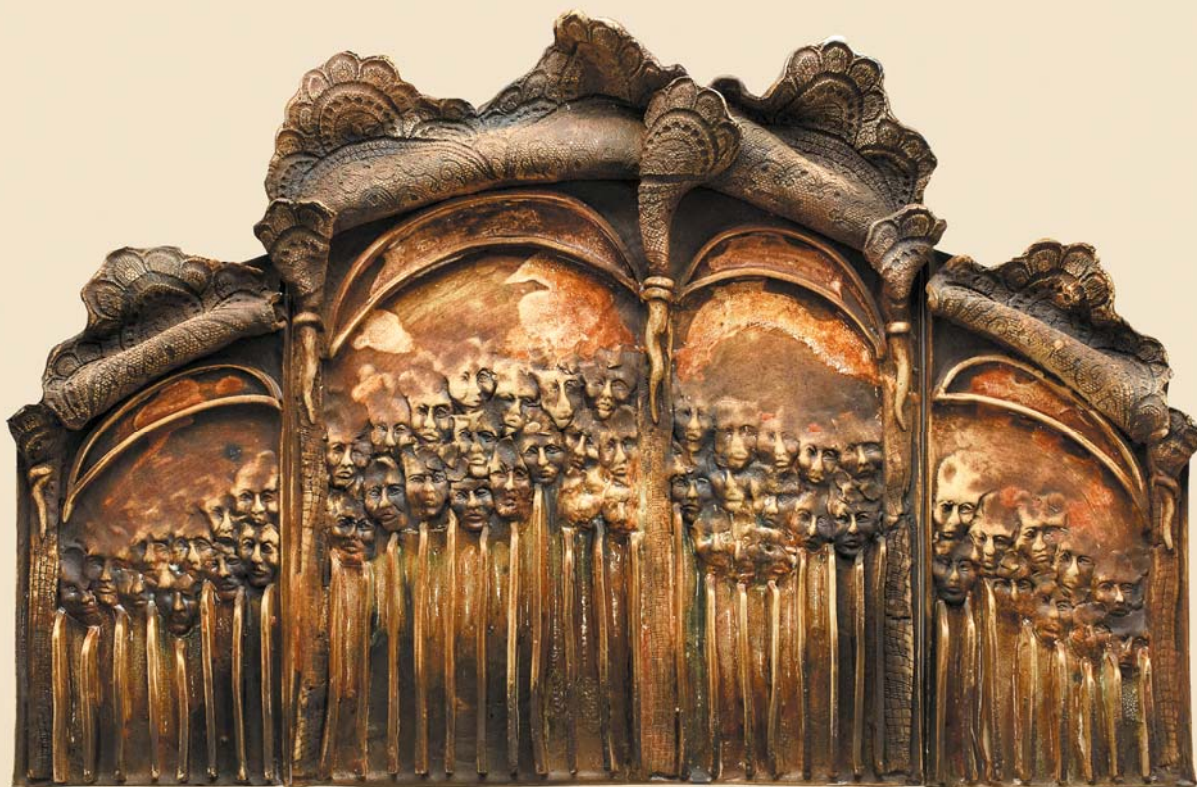
Pasja , tryptyk, 60×40 cm, porcelit