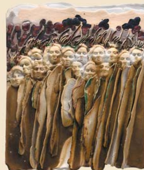
Concertino, 30×30 cm, porcelit

Twórczość Jolanty Kasińskiej – utalentowanej wrocławskiej artystki i znakomitego pedagoga – obejmuje prace o różnorodnej tematyce, utrwalanej zarówno w grafice użytkowej, malarstwie czy rzeźbie, jak i w ukochanej unikatowej ceramice. Ta niezwykle trudna dziedzina sztuki od ponad 30 lat niepodzielnie króluje w warsztacie artystki. Zaowocowała wyjątkowymi dziełami, które intrygują bogactwem kształtów, niepokoją tajemniczością ukrytych znaczeń, urzekają bujnością twórczych pomysłów i artystycznych inspiracji. Odnajdujemy wśród nich fascynację życiem we wszystkich jego przejawach, zachwyt urodą i złożonością świata, głębokie odczucie piękna natury i niepokój wywoływany siłą jej groźnych zjawisk czy niszczących żywiołów.