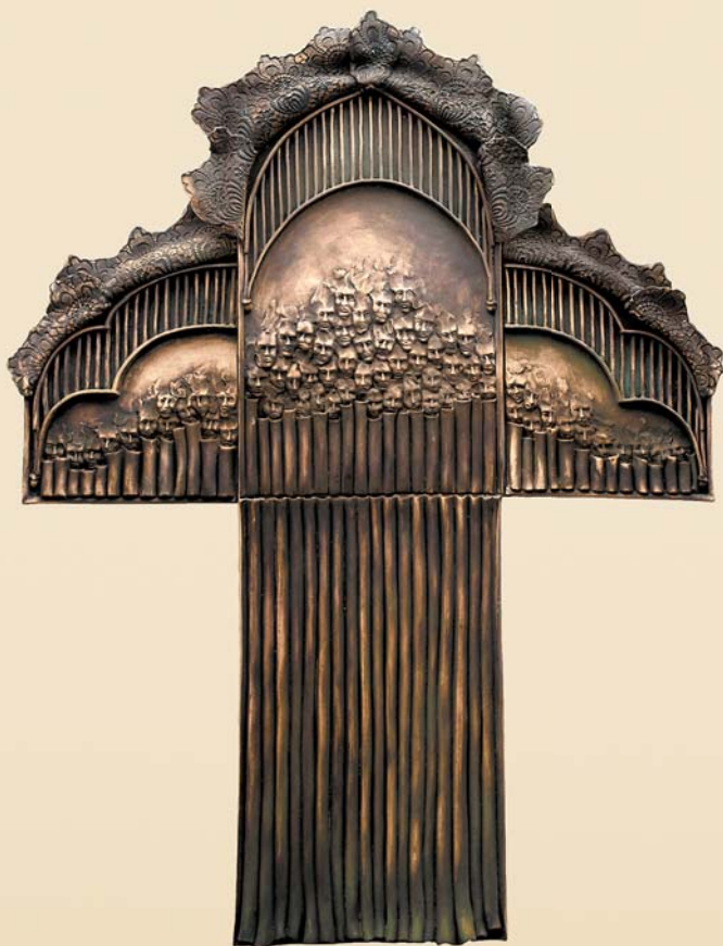
Oratorium – Magnificat , 100×130 cm, kamionka