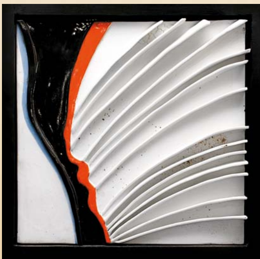
Źródło życia , 30×30 cm, porcelana