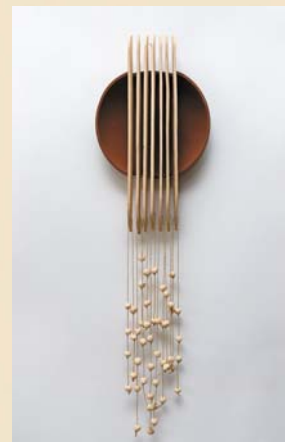
Jesienna fantazja 25×50 cm, porcelit