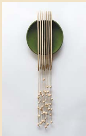
Wiosenna fantazja 25×50 cm, porcelit

Oprac. graficzne i DTP: Sławomir Pęczek – editus.pl • Redakcja tekstów: Kazimiera Kuzborska • Zdjęcia: Przemysław Kuzborski