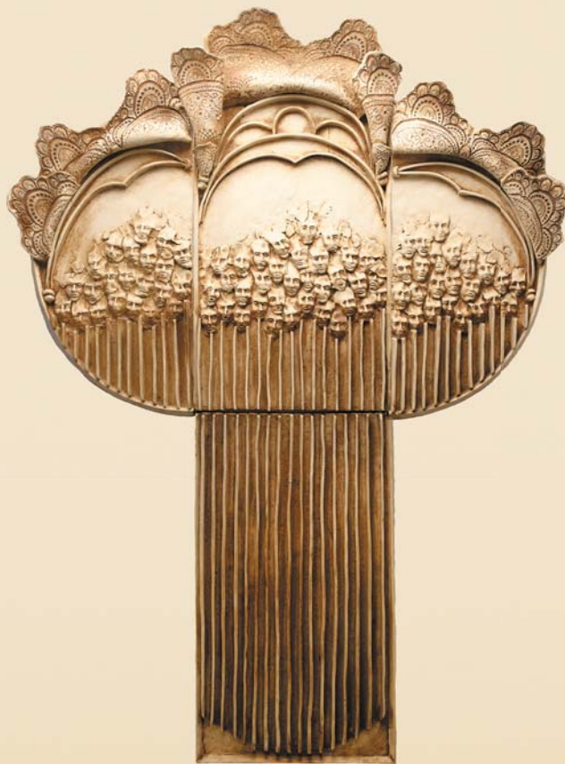
Oratorium I , 100×120 cm, kamionka