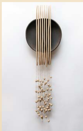
Zimowa fantazja 25×50 cm, porcelit