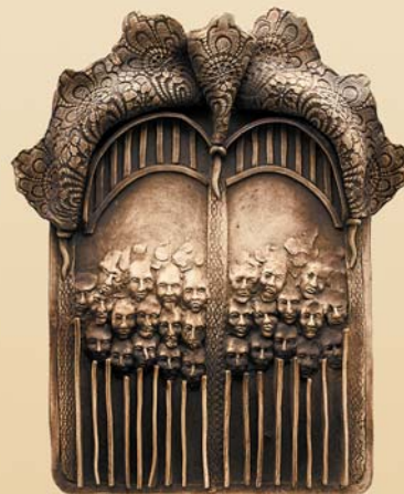
Sonata , 40×50 cm, porcelit