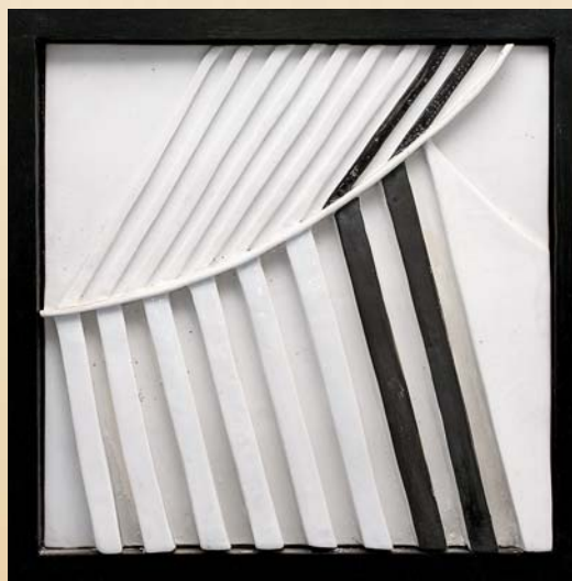
Refleksja , 30×30 cm, porcelana